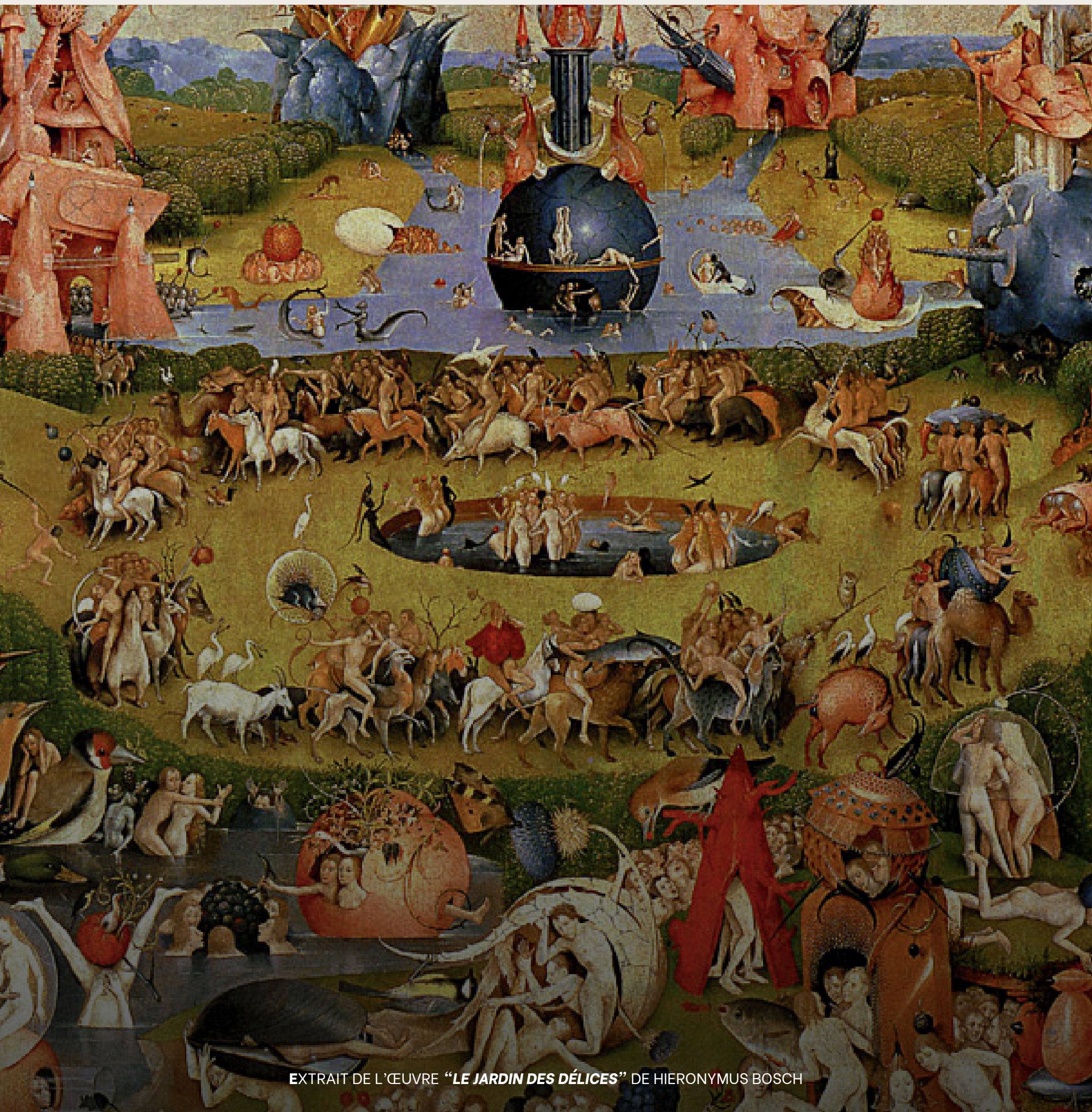
EXTRAIT DE L'ŒUVRE "LE JARDIN DES DÉLICES" DE HIERONYMUS BOSCH